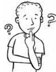
daarom denk ik goed na...