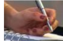
ik schrijf mijn gevoel op een stukje papier...

Maar dit kan niet meer, ik sta op en demonstreer 15 , protesteer tegen degene die probeert onrust te zaaien 16 waaronder de media 17 die mijn woorden verdraaien omwille van sensatie 18 . Iedereen is gelijk, fuck discriminatie. De wereld bevindt zich nu in een kutsituatie.