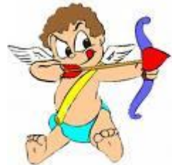
Amor mist nooit met zijn pijlen...

Maar na jaren werd het haar te machtig 10 en vertelde zij het hem maar. Iwan vond het eigenlijk wel prachtig en werd snel verliefd op haar. Maar toen hij dus zijn aanstaande 11 voor de schijf zag staan keek hij haar opeens met hele andere ogen aan, werd nerveus 12 , hij trilde 13 , miste, raakte en ze zakte in elkaar 14 , en met een laatste blik 15 op hem zong zij met reeds gebroken stem: