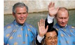
wereldleiders verklaarden oorlogen...