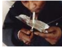
junks zijn op zoek naar een stukje folie...