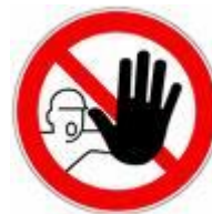
barricades in menselijke vorm...