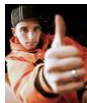
een positieve mentaliteit