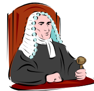
de rechter zegt: je bent een jeugddelinquent!

De rechter zei: "Hé Jantje, weet jij wel wat je bent? Dat noemen wij juridisch 6 jeugddelinquent 7 . Een schande voor je ouders, je toekomst naar de maan 8 , want als je later groot bent, krijg je nooit een goede baan."