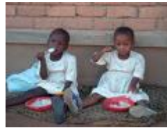
eten voor een Afrikaans kind is te duur...