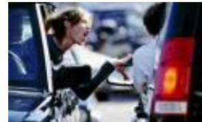
agressie in het verkeer...