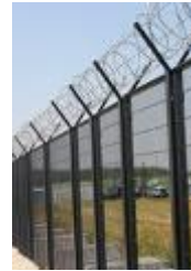
hindernissen blokkeren mijn wegen...