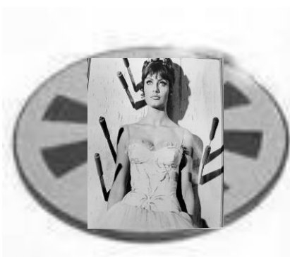
Hij zag zijn aanstaande voor de schijf staan...