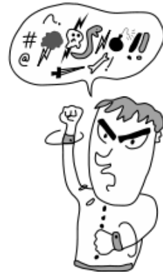
Dan scholden wij ze poep...