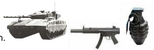
bewapend met tanks, mitrailleurs en granaten...