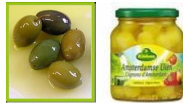
ik heb mooie olijven en uitjes in het zuur...

Amsterdam huilt, waar het eens heeft gelachen Amsterdam huilt, nog voelt het de pijn. Amsterdam huilt, waar het eens heeft gelachen Amsterdam huilt, want weg is de gein.