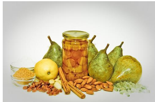
Het recept en de ingrediënten van Kugel met peren