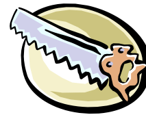
Ma stuurde hem een zaag

Toen haalde men er een heel stel psychologen bij, die vonden hem gevaarlijk voor de maatschappij. Vandaag een rijksdaalder en morgen een kluis 15 . Hupsakee, de bajes 16 in en weg met dat gespuis 17 .