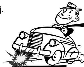
De kar kreeg een lekke band

Hiermede eindigt het verhaal van onze held 20 . Een blues voor Jantje zongen de vogels in het veld. "Jezus", zei de dominee, "sta zijn zieltje 22 bij 21 ." Maar Jantje had er maling aan 23 , want Jantje was vrij. Jantje was vrij. Jantje was vrij.