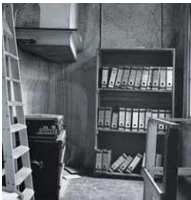
Achter de boekenkast: onderduiken in het Achterhuis

In 1941 werden voor het eerst joden gearresteerd. Deze joden werden weggevoerd in vrachtauto's en kwamen niet meer terug. Het leven voor joden was erg gevaarlijk geworden. Ze wisten dat ze door de Duitsers konden worden opgepakt.