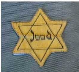
De gele ster voor joden

Hitler wilde het leven voor de joden zo moeilijk mogelijk maken. Hij wilde de joden duidelijk maken dat ze niet meer welkom waren. Joden werden steeds vaker op straat gepest. Er kwamen wetten die de joden verboden normaal te leven. In 1933 begrepen veel joden dat ze geen toekomst meer in Duitsland hadden. Daarom vluchtte Anne Frank met haar ouders en haar zus in 1933 naar Nederland. In 1940 viel Duitsland Nederland aan. Nederland gaf zich na 5 dagen gewonnen. Duitsland had het toen voor het zeggen in Nederland. Snel kwamen er regels om het leven voor de joden moeilijk te maken. Joden moesten een gele ster op hun kleren dragen. Ze mochten niet meer met de tram rijden en ze mochten niet meer overal werken.