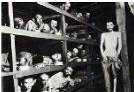
een Duits concentratiekamp

Toen ze 13 jaar werd, kreeg Anne van haar ouders een dagboek als cadeau voor haar verjaardag. Iedere dag schreef zij in het dagboek. Zij schreef over het leven in het Achterhuis. Zij schreef over zichzelf en de andere mensen in het Achterhuis. In 1944 kwamen de Duitsers. De Duitsers arresteerden Anne Frank en de zeven andere mensen. Anne Frank werd op een trein gezet en werd naar Auschwitz, een kamp in Polen, gebracht. Later werd zij naar een kamp in Duitsland gebracht. Dat kamp heette Bergen Belsen. In dat kamp werd Anne Frank ziek. Anne Frank stierf daar vlak voor het einde van de oorlog in 1945.