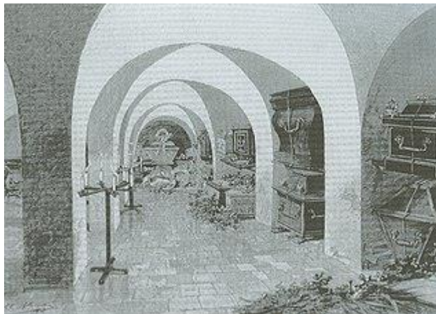
De grafkelder van Willem van Oranje en zijn familie