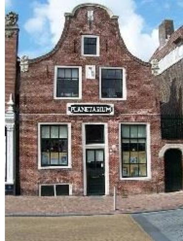
het museum