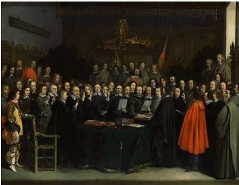
1648: Nederland en Spanje tekenen de vrede in Münster (Duitsland)

Pas veel later, na 80 jaar oorlog, tekenen Nederland en Spanje in 1648 de vrede 13 . De koning van Spanje is niet meer de baas in Nederland. Nederland is een onafhankelijk land. Een land met een eigen regering, een eigen vlag en een volkslied. Het volkslied van Nederland gaat over Willem van Oranje. Het Nederlandse volkslied heet daarom 'Het Wilhelmus'*.