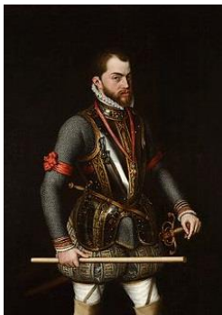
Filips de Tweede

Willem van Oranje is het niet eens met de koning van Spanje. Hij kiest de kant van de Nederlanders. Hij vindt de koning van Spanje te streng. Hij wil dat katholieken en protestanten respect voor elkaar hebben. Na de 'beeldenstorm' (het kapot maken van de beelden in kerken) vlucht Willem naar Duitsland. Willem van Oranje is tegen de regering van de hertog van Alva. Hij wil Alva weg krijgen uit Nederland. Hij koopt kanonnen 9 en zoekt soldaten. Hij organiseert een leger 10 .