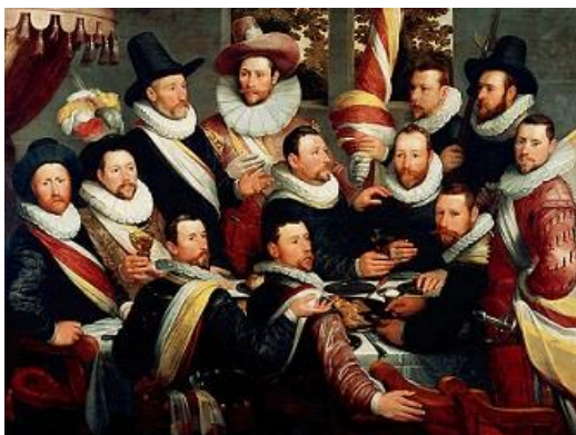
Cornelis van Haarlem: Banket van de officieren van de St. Jorisdoelen

Een van de dingen die Rembrandt zo speciaal maken is dat hij een echte vernieuwer was: hij had originele ideeën en durfde nieuwe dingen uit te proberen, ook als de opdrachtgever daar niet altijd zo blij mee was. Speciaal is ook het gebruik van licht en donker in zijn schilderijen: de belangrijke mensen en dingen in zijn schilderijen staan altijd prachtig in het licht. Hij had een fantastisch gevoel voor compositie 7 en dramatiek 8 en wist echt leven in zijn schilderijen te brengen. Een goed voorbeeld is de Nachtwacht, het bekendste schilderij van Rembrandt. Het is een groot schilderij waarop schutters te zien zijn. Schutters waren een soort soldaten of politiemensen. Zij moesten de stad beschermen 9 . Er zijn in de 'Gouden Eeuw' veel schuttersstukken gemaakt. De schutters betaalden samen het schilderij, en wilden dus allemaal goed in beeld komen. Daarom waren het nogal statische 10 en soms zelfs een beetje saaie 11 schilderijen. Hier zie je een min of meer traditioneel schuttersstuk: