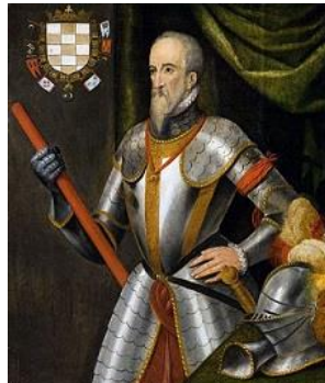
De hertog van Alva

In 1568 is het eerste gevecht tussen de legers van Willem van Oranje en Spanje. Het is het begin van een oorlog tussen Nederland en Spanje. Willem van Oranje is de leider van de opstand tegen Spanje. In 1581 laat Nederland aan de wereld weten dat ze een onafhankelijk land zijn, en dat de koning van Spanje niet meer hun koning is. Dat doen ze met een document, dat het ' Plakkaat van Verlatinghe ' heet.