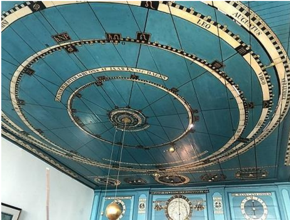
het planetarium van Eise Eisinga

In Franeker, een stadje in Friesland, kan je iets unieks zien: het oudste nog werkende planetarium 1 ter wereld. Het werd tussen 1774 en 1781 gebouwd door Eise Eisinga, in zijn eigen huiskamer.