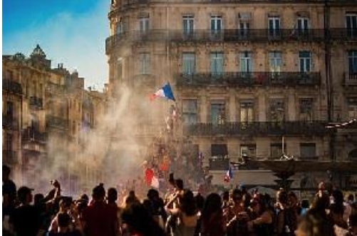
de Franse revolutie

Nederland is nu een koninkrijk, met Willem Alexander als koning. Maar dat is niet altijd zo geweest. Vanaf de Tachtigjarige Oorlog (1568 – 1648) was Nederland een republiek. Pas in 1806 kreeg Nederland zijn eerste koning. Dat was geen Nederlander, maar een Fransman: Lodewijk, de broer van Napoleon. Hoe werd hij koning van Nederland?