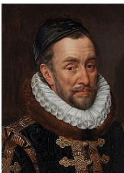
Willem van Oranje

De koning van Spanje vindt dat goed, maar dan moet Willem wel aan het hof 5 in Brussel komen wonen en katholiek opgevoed worden. Daarom verhuist Willem als hij 12 jaar is naar Brussel, naar 'de lage landen'. Later gaat hij voor de koning van Spanje werken. Hij is een soort ambtenaar 6 .