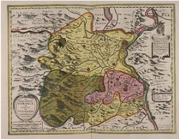
Het prinsdom Oranje (het roze stuk op de kaart) ligt in Zuid-Frankrijk

Willem van Oranje wordt in 1533 in Duitsland geboren. Zijn ouders zijn protestant 3 . De koning van Spanje, Karel de Vijfde, is katholiek. Hij is ook koning van een groot deel van Europa, bijvoorbeeld van Duitsland, Frankrijk en van 'de lage landen' (Nederland en België). In 1544 sterft een neef van Willem, en erft 4 Willem het prinsdom Oranje in Frankrijk. Hij is dus ineens een prins.