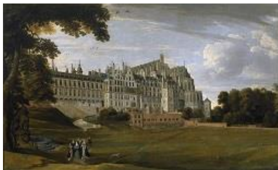
Het hof van Karel de Vijfde in Brussel