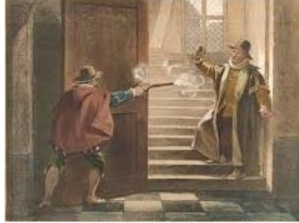
De moord op Willem van Oranje