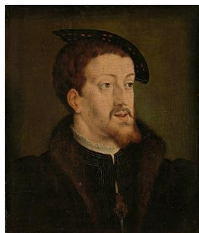
Karel de Vijfde